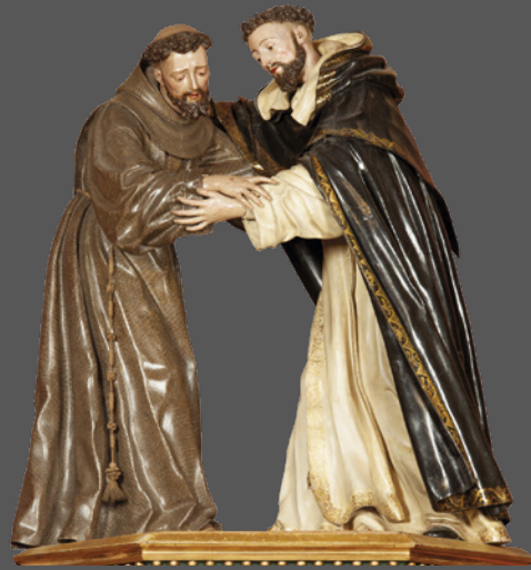
42. Abrazo de Santo Domingo y San Francisco