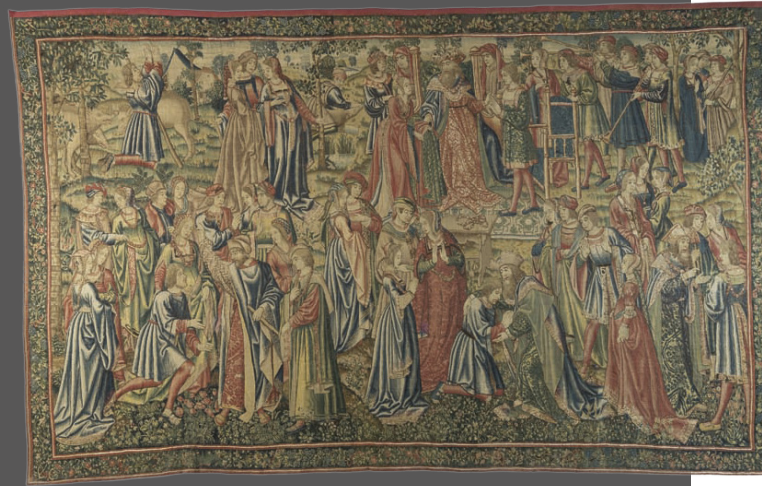
30. El regreso del hijo pródigo