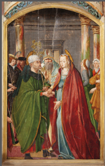
41. Desposorios de la Virgen