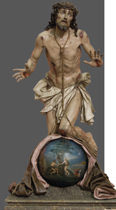
46. Cristo del Perdón