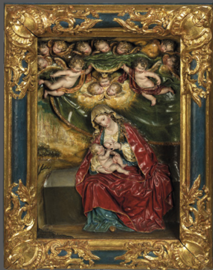
25. Virgen de la leche