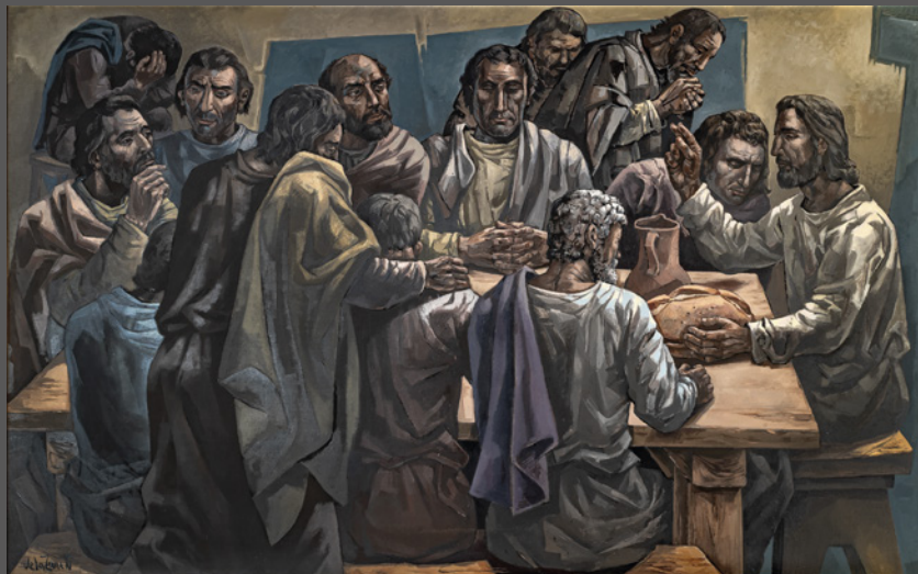
48. Sagrada Cena

¿Por qué la Eucaristía debe llevarnos a amar más al prójimo y a ser más hospitalarios?