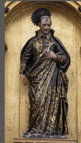
39. San Vicente de Paúl