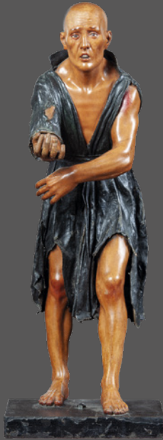
33. El pobre Lázaro