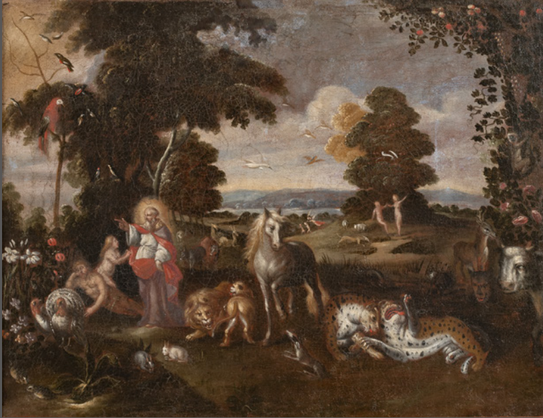
44. La creación

'ANAGOGIA TENDERE' ¿Qué me cabe esperar?