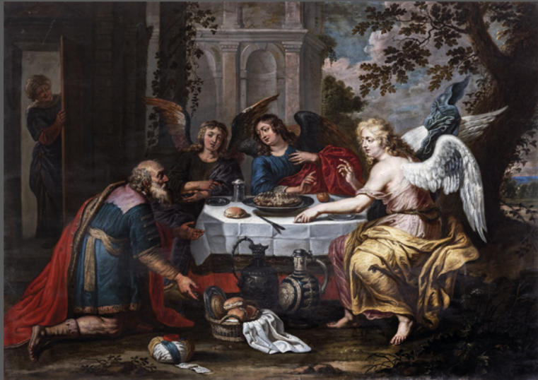
50. La hospitalidad de Abraham