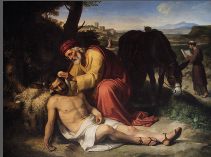
29. El Buen Samaritano