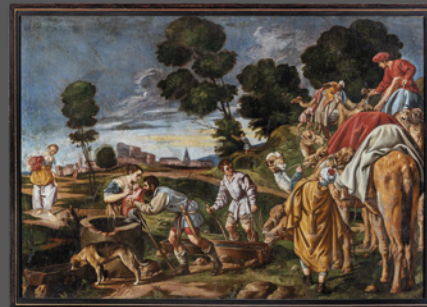
6. Rebeca dando de beber a Eliezer