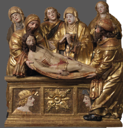
7. Entierro de Cristo