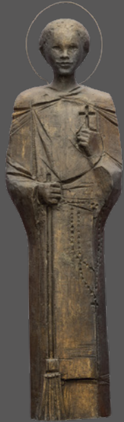
32. San Martín de Porres