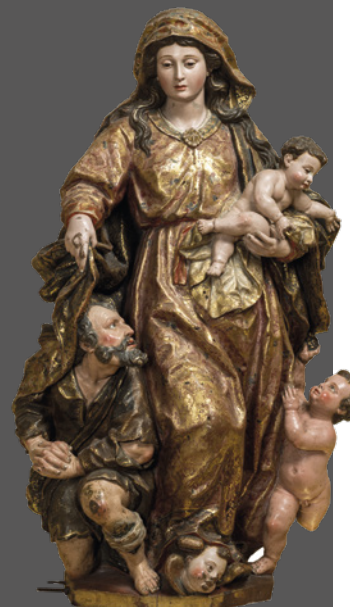
26. Virgen de los Pobres