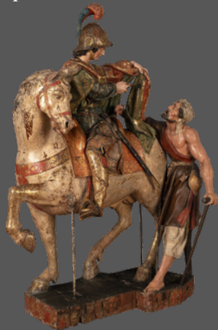
3. San Martín y el pobre