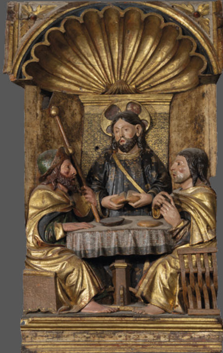
49. Cena de Emaús