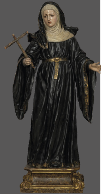
38. Santa Rita