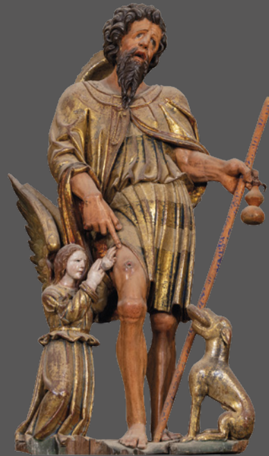
14. San Roque