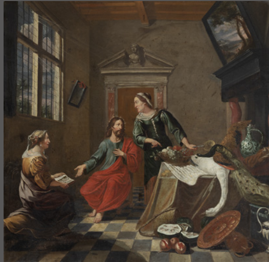
11. Cristo en casa de Marta y María

A continuación te proponemos una investigación sobre estas imágenes: