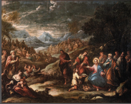
5. Multiplicación de los panes y los peces