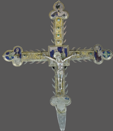
16. Cruz procesional