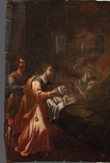
15. San Julián y Santa Basilisa cuidando enfermos