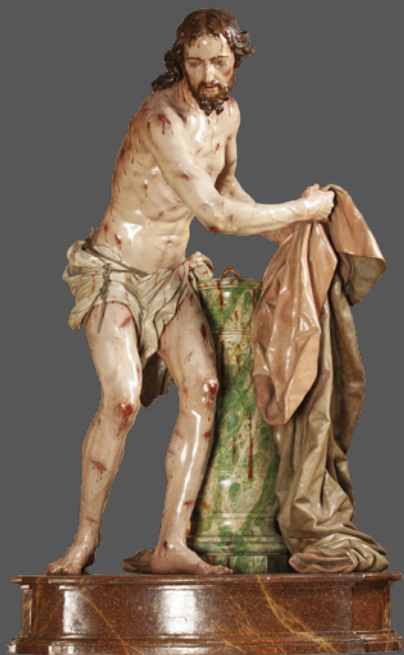
13. Cristo recogiendo sus vestiduras