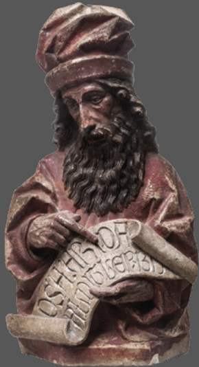
9. Profeta Ezequiel