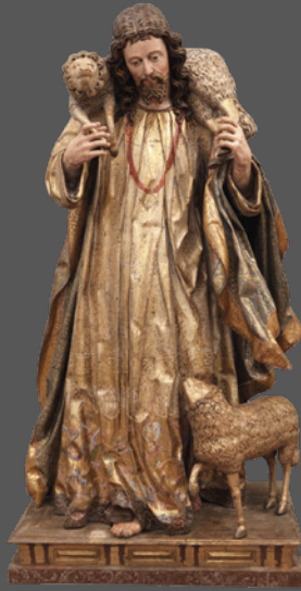
17. Buen Pastor