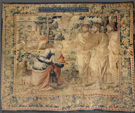
19. Abraham y los tres ángeles