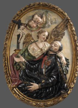
37. San Camilo de Lelis