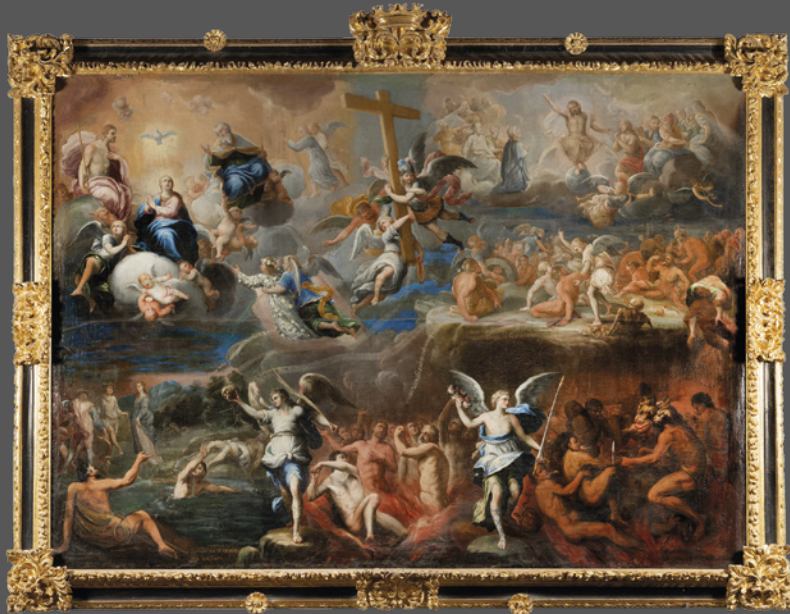
51. El juicio final