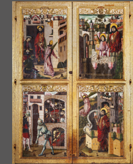
4. La liberación de San Pedro de la cárcel