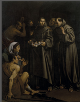
35. San Diego de Alcalá