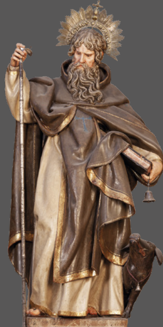
34. San Antonio Abad