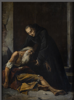
36. San Juan de Dios