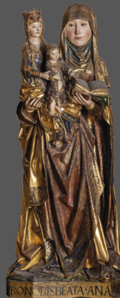
27. Santa Ana Triple