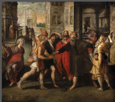
1. Dar posada al peregrino