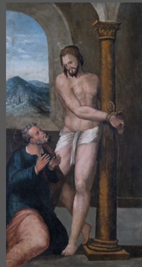
31. Jesús atado a la columna y lágrimas de San Pedro