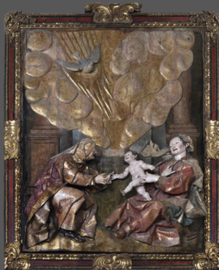
43. Santa Ana, la Virgen y el Niño