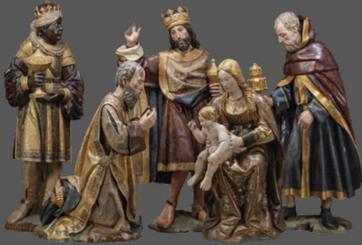
18. La adoración de los Magos