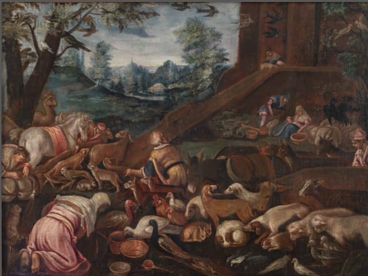
45. El arca de Noé