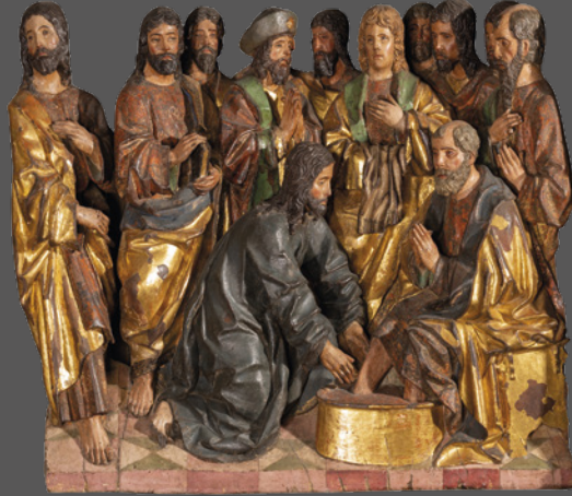
28. El Lavatorio de los pies