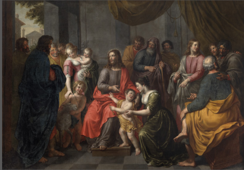
10. Dejad que los niños se acerquen a mí