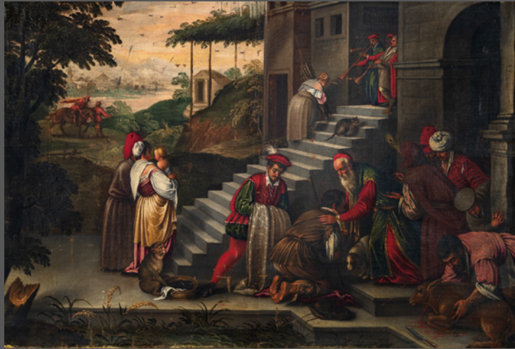
12. El regreso del hijo pródigo