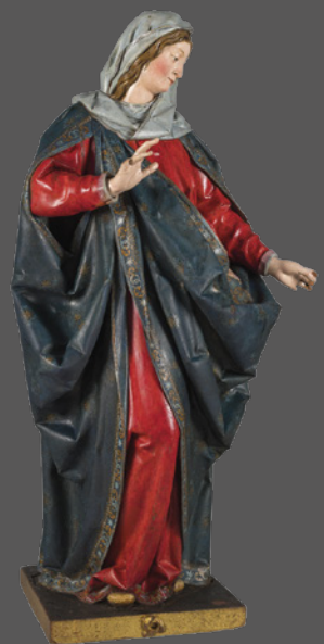
24. Sagrada familia