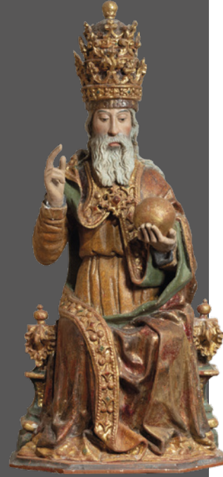
20. Dios Padre